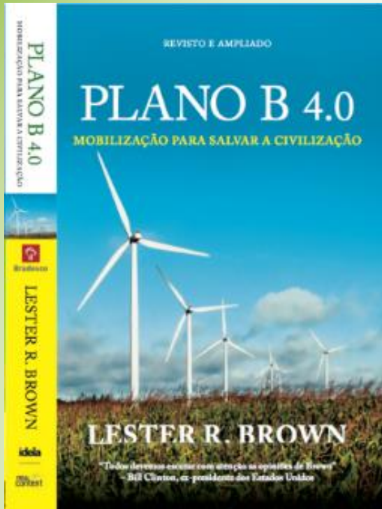
Plan B 4.0: Mobilizing to Save Civilization Lester Brown